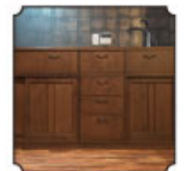
こだわりの造作キッチン