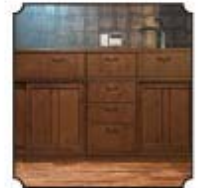
こだわりの造作キッチン