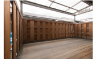
広いウッドデッキ