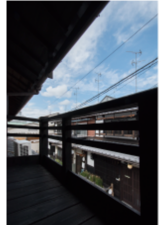
キッチン横の窓辺に腰掛けて見える風景