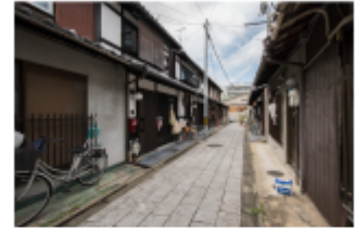
物件前の道：風情ある石畳の道