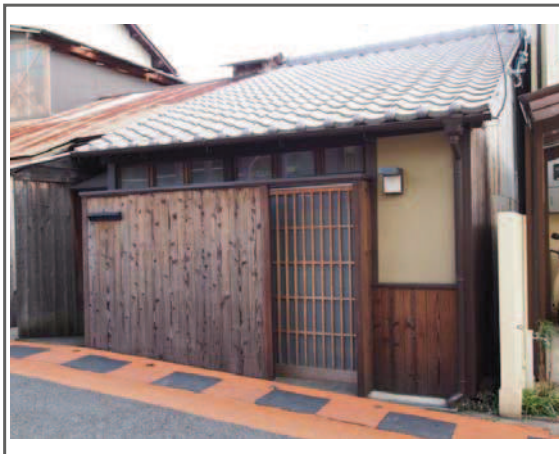
細部にまでこだわりぬいた京町家、ナラや杉・桧等の無垢材を使用した落ち着いた雰囲気