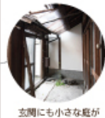
玄関にも小さな庭が