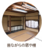
昔ながらの露や檼