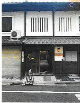
トンネル路地入口