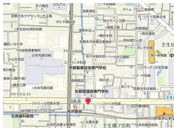
四条千本西入南側5軒目