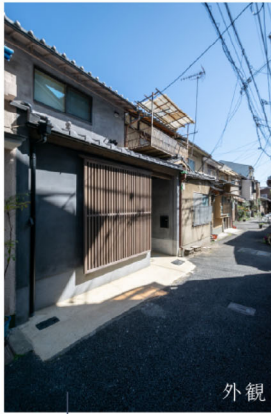
姉小路通から入る、静かな南側の路地