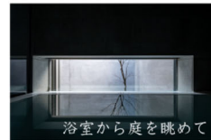
浴室から庭を眺めて