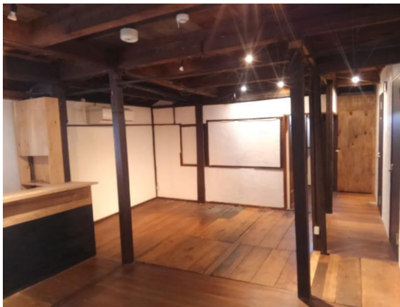
四条千本西入南側 5 軒目南側