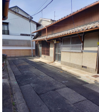
現地案内図・物件図面